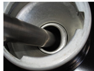
給油ノズルでフラップを押し込んだ状態