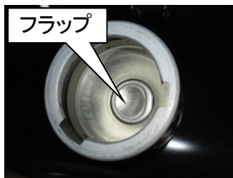
給油口内に取付けているフラップ

弊社ではこの要件を満足させるために給油口内に給油ノズルの押し込み時以外はフタとなる構造のフラップを取付けております。